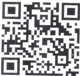
QR Code เว็บไซต์มูลนิธิครูดีของแผ่นดิน